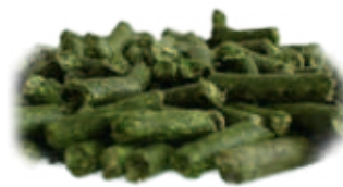
Granulés de 6 mm